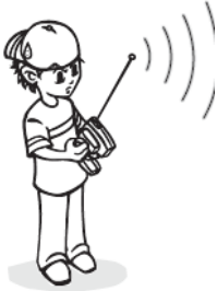
перевірка дальності радіокерування